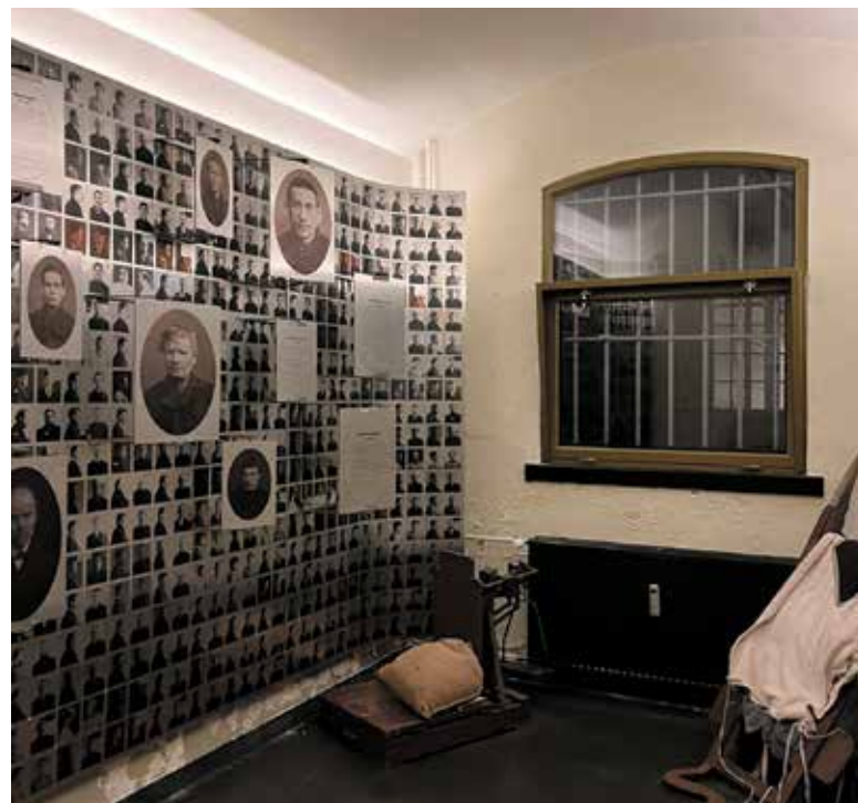
Fotogalerij met meer en minder vermaarde bewoners van de Blokhuispoort. Rechts een kruiwagen met dwangbuis voor transport van opstandigen.